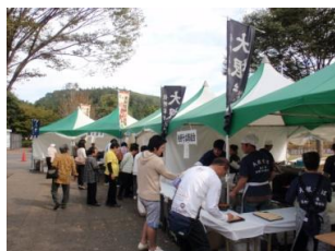
佐野市そばまつり 田沼グリーンスポーツセンター