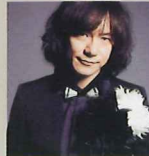
全国山城サミットin佐野侍の大将ダイアモンドユカイ氏