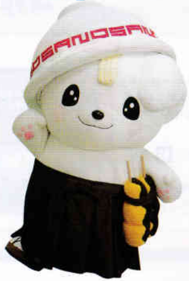
佐野ブランドキャラクター さのまる