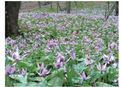
咲き乱れるカタクリの花