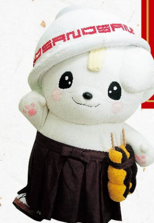
佐野ブランドキャラクター 「さのまる」©佐野市