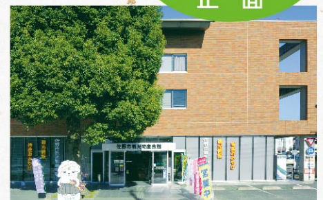
佐野市観光物産会館