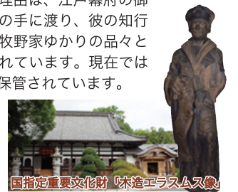
国指定重要文化財「木造エラスムス像」