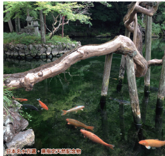
日本名水百選・県指定天然記念物