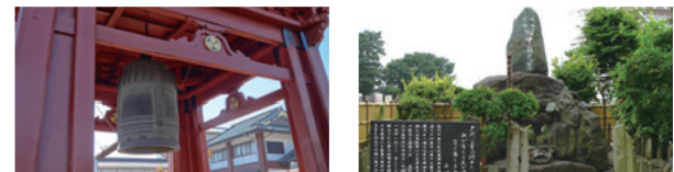
明慶4年に天明の鋳物師が寄進した梵鐘。佐野市出身の政治家、田中正造の墓所があります。墓石は正造が愛した渡良瀬川流域産のものが使われています。