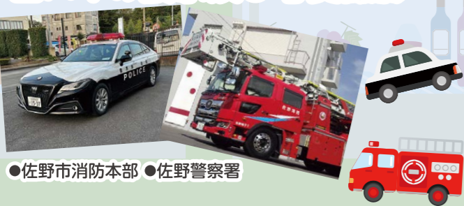
●佐野市消防本部 ●佐野警察署