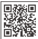
佐野市観光推進課X

どまんなかフェスタ佐野実行委員会事務局 電話番号 0283-27-3011 (佐野市観光推進課) イベント当日(本部直通) 0283-62-9113