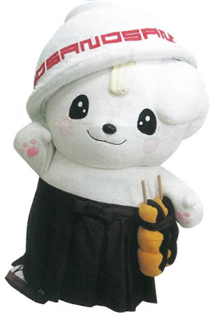
佐野ブランドキャラクター さのまる ©佐野市 http://sanomaru225.com/